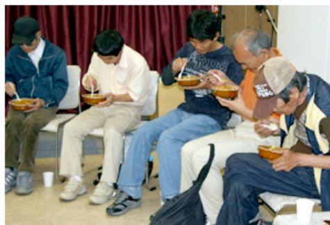
Após o culto, desabrigados recebem um prato de arroz com curry, roupas e podem conversar sobre seus problemas

No dia 16 de maio, a unidade em Hamamatsu da Igreja Praise Church foi inaugurada com um culto para japoneses seguido de distribuição de alimentos. A igreja está também em outras duas localidades, Iwata (Shizuoka) e Okazaki (Aichi).