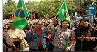
Imigrantes brasileiros protestaram em Tóquio e em Hamamatsu

Em Tóquio e em Hamamatsu, imigrantes brasileiros também fizeram manifestações, em protesto contra a discriminação de estrangeiros no mercado de trabalho.