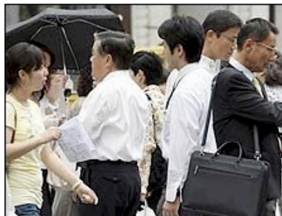
O fim da recessão ainda não foi sentido pelos japoneses

O total de desempregados no país chegou a 3,5 milhões e aumentou pela nona vez consecutiva. Em junho, o índice foi de 5,5%.