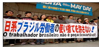
Brasileiros reclamam de discriminação no mercado de trabalho

Na cidade, segundo associações locais, cerca de 30 famílias já deram entrada no pedido e devem embarcar de volta ao Brasil no começo de maio. Mas muitos de kasseguis consideram a medida discriminatória e reclamam do fato de o governo não permitir que os beneficiados pelo esquema possam retornar ao Japão a curto prazo.