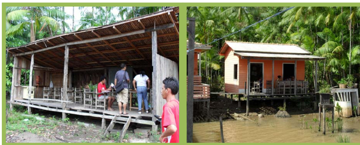
Fotografia 11 (esquerda): Escola Jerusalém cercado apenas as laterais - cedido pelo professor para funcionar a escola.

Nestes locais os ambientes como secretaria, copa, cozinha, banheiros, sala de leitura e área para recreação inexistem, algumas são fechadas, outras apenas cobertas com palha, para evitar as intempéries do tempo. Nas fotografias 11 e 12, a seguir, se evidenciam as características estruturais desse tipo de escola: