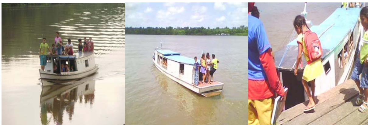
Fotografia 24 (esquerda): Barco transportando alunos para escola com alguns alunos sobre o toldo. Fotografia 25 (centro): Barco transportando alunos para escola com alguns em pé na parte de traz. Fotografia 26 (direita): Barco no porto da escola embarcando alunos para o retorno a suas casas.

o barco, há ausência de aluno na escola. As fotografias 24, 25 e 26, a seguir, mostram um mosaico de fotografias com os tipos de embarcações que são alugados dos ribeirinhos para o transporte dos alunos.