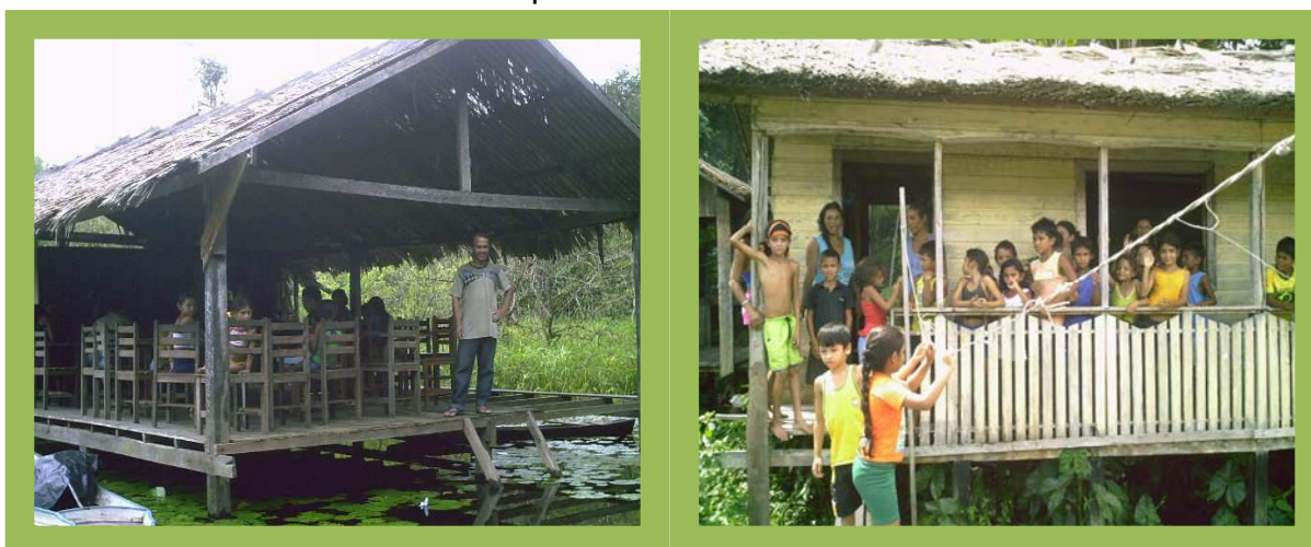
Fotografia 9 (esquerda): Escola que funciona em residência apresenta o professor em pé e atrás os alunos nas cadeiras

As escolas que funcionam em casas representam cerca de 12,68% do total das constituídas no meio rural. São aquelas cedidas por um morador da comunidade ou pelo professor para funcionar a escola. Diante da compreensão que as famílias têm que, nos processos de escolarização de seus filhos sem o poder público, assumir tal responsabilidade com a construção da escola, elas oferecem como contraproposta a concessão de parte de seus lares, geralmente a sala, para funcionar como espaços educativos. Como já evidencia no quadro 3, são 43 escolas que funcionam nessas condições. Através das fotografias 9 e 10, a seguir é possível evidenciar duas residências em que funcionam as escolas.