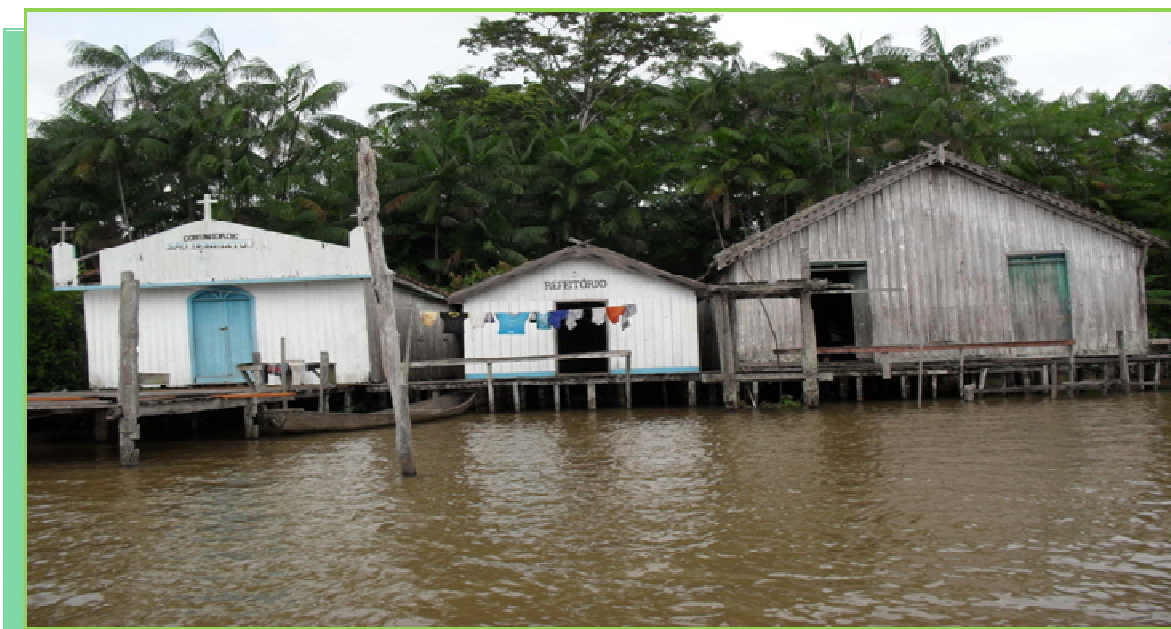
Fotografia 13: Escola que funciona em centros comunitários.

Outros espaços em que funcionam as escolas são nos centros comunitários e representam cerca de 6,19% das escolas da área rural. São espaços das comunidades cristãs, evangélicas ou de particulares utilizados para realização de eventos e cedem, geralmente, por um período com a promessa da construção da escola no local. Como geralmente o poder público não cumpre o prometido, a escola continua a funcionar nestes espaços por décadas, a fotografia 13 a seguir, evidencia um destes locais que se multiplicam no município: