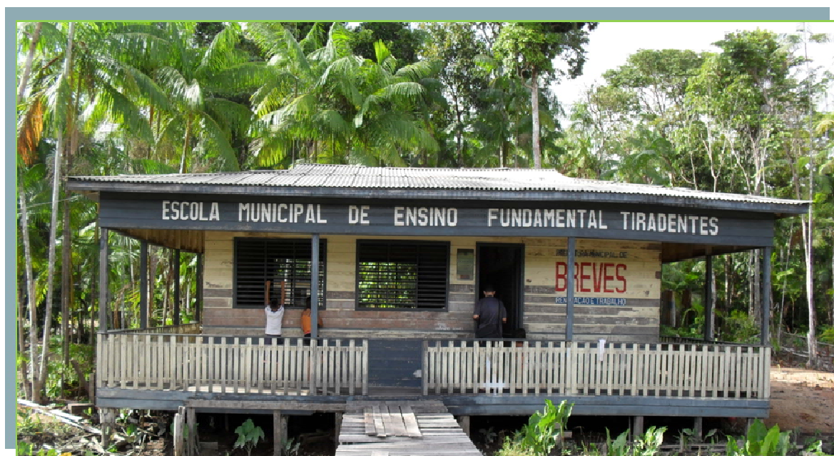
Fotografia 8: Modelo de escola padrão do município.

Como se percebe, é um número inexpressivo, uma vez que isso representa pouco mais de um terço do total. Outro problema é que, como a maioria das escolas é construída em madeira, já estão deterioradas e precisando de reformas ou reconstruções. Esses dados evidenciam que os governos que vêm se sucedendo na gestão municipal, não têm garantido às populações do campo a construção de escolas capazes de atender a sua demanda. O quadro apresenta, também, os mais diversos espaços em que funcionam as escolas como: escola padrão, casas (residências) 13 , casas cedidas 14 , centros comunitários, Igrejas e Sedes 15 . Destaca-se que as escolas denominadas padrão, são as construída pelo poder público, conforme evidenciado pelo modelo na fotografia 8, a seguir: