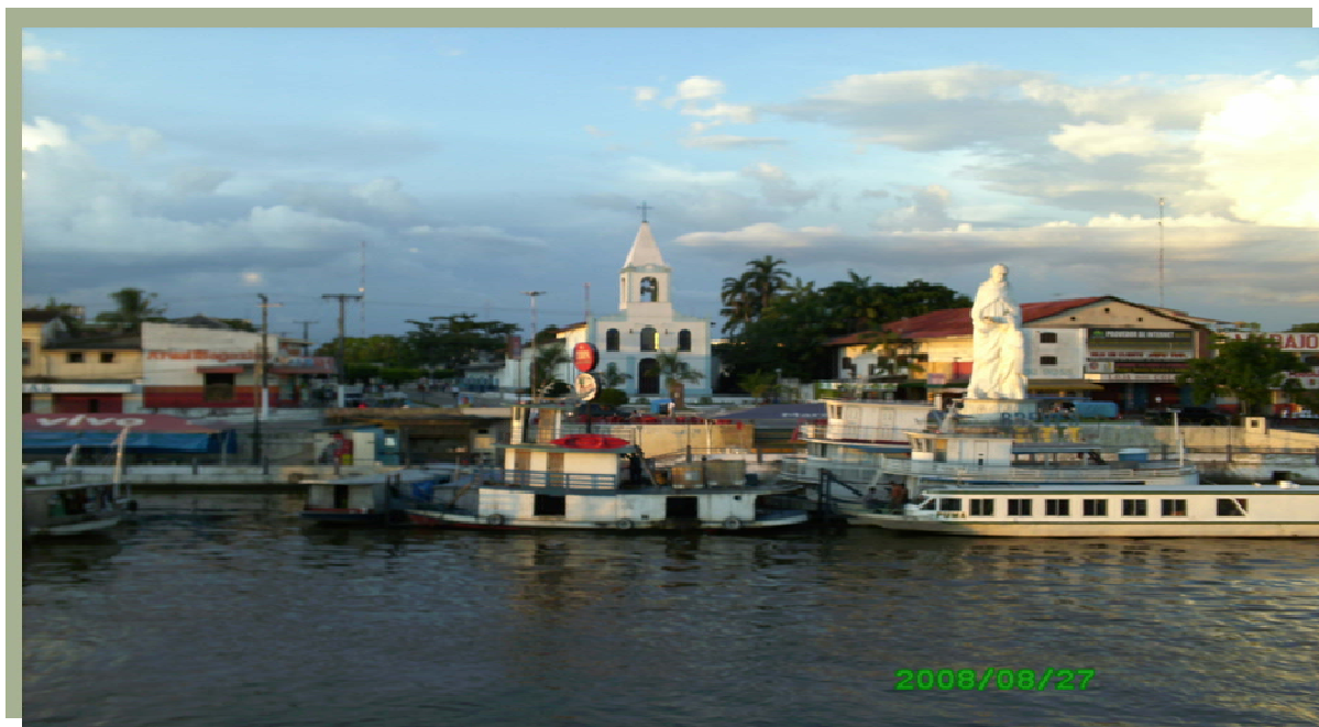
Fotografia 1: Frente da Cidade de Breves.

De acordo com a Lei nº 2.114/2006 (BREVES, 2006b), a cidade é composta por sete bairros oficiais, a saber: Centro, Cidade Nova, Aeroporto, Riacho Doce, Castanheira, Santa Cruz e Parque Universitário, este não é reconhecido pela população, ao contrário de outros três que surgiram após a provação da lei como Paraíso, Jardim Tropical e Cidade Nova II, todos iniciados a partir de distribuição de lotes pela prefeitura. Nos bairros periféricos a população usa energia de forma clandestina, não possui água encanada, rede de esgoto, coleta de lixo seletiva, ou seja, o saneamento básico é zero. Alguns desses bairros não possuem nem mesmo unidades educacionais, tendo os estudantes que se deslocarem para escolas localizadas em outros bairros.