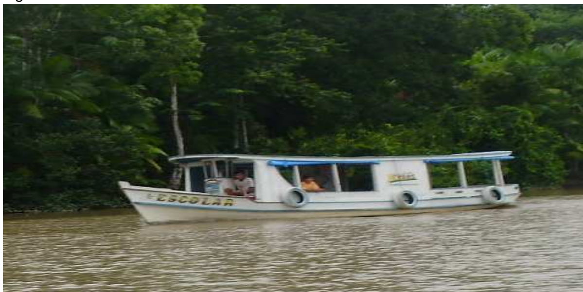
Fotografia 27: Transporte escolar de propriedade da SEMED.

A saída seria o governo municipal investir em uma frota própria, o que ainda não se visualiza em curto prazo, pois até o momento a SEMED dispõe de um único transporte de sua propriedade, como se verifica em detalhes na fotografia 27 a seguir: