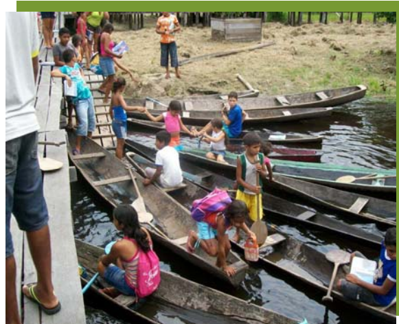
Fotografia 2 (esquerda): Duas canoas conduzindo cinco crianças à escola