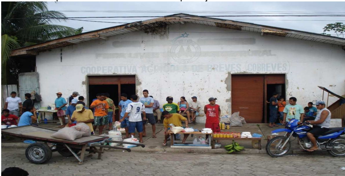
Fotografia 4: frontal da Sede da APRACOTAN onde funciona a feira do produtor Fonte: Arquivos da pesquisa (2009).

Neves (APRACOTAN), ou nos mercados da cidade. A fotografia 4 a seguir, evidencia os produtores comercializando a produção na referida feira.