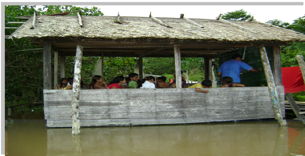
Fotografia 20: Espaço de funcionamento de uma escola multisseriada.

O relato clarifica as dificuldades enfrentadas pelos professores, onde as aulas são constantemente interrompidas pelas atividades da família, o que acaba interferindo na aprendizagem dos alunos e, conseqüentemente, influenciando no processo educacional. Além do mais, as atividades pedagógicas ficam restritas as aulas expositivas, pois não possuem outros espaços senão os das salas de aula. Para as famílias, cansadas de esperar por uma ação do governo, tomam para si a responsabilidade da implantação das salas de aula. Esse imprevisto tem se perpetuado por décadas. A fotografia 20, a seguir, retrata o contexto de descaso em que as escolas funcionam no Município de Breves.