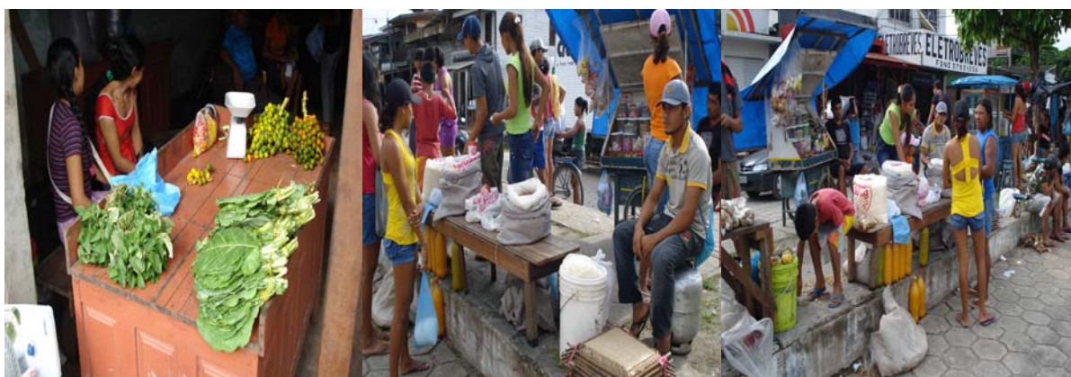
Fotografia 5 (esquerda): Duas produtoras vendendo sua produção oriunda da agricultura familiar sobre uma banca.

Como se observa na fotografia 4, parte frontal do espaço da associação dos produtores, nota-se que este se apresenta bastante deteriorado e sem infraestrutura adequada internamente, o que justifica a preferência dos usuários desse espaço em comercializar seus produtos na frente da sede da associação, sobre a calçada. De acordo com eles, é uma forma de atrair compradores, as fotografias a seguir evidenciam essa realidade: