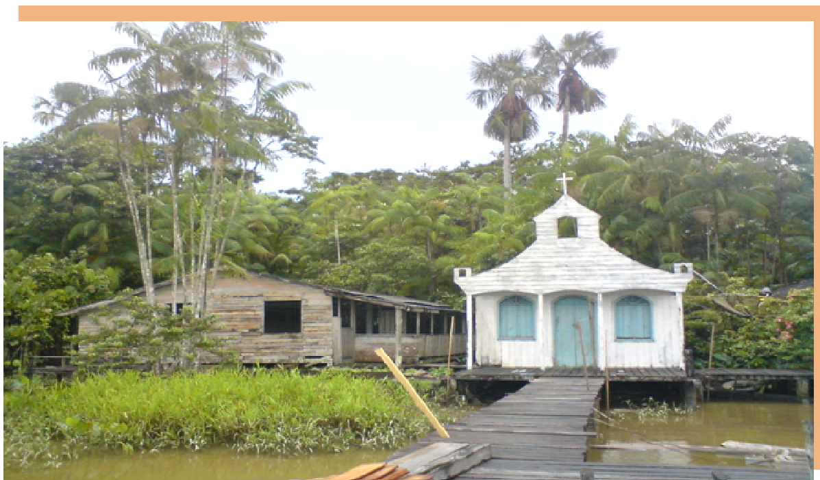
Fotografia 14: Escola que funciona em igrejas.

As igrejas também são espaços onde funcionam escolas. Elas representam 6,19% do total das escolas do meio rural. Geralmente são cedidas seja por igrejas evangélicas ou católicas. Nesses locais, também, não há espaço para fazer a alimentação dos alunos e guardar os materiais didáticos. Os banheiros também são inadequados para as crianças. Na fotografia 14, a seguir, se evidencia uma das igrejas em que funciona uma das escolas do município.