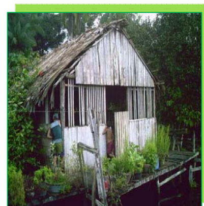
Fotografia 17 (esquerda): EMEF Jerusalém – Rio Jaburu Fotografia 18 (centro): EMEF Boa Esperança Tambururi Fotografia 19 (direita): EMEF Livramento – Rio Mapuá

As três escolas indicadas nas fotografias acima revelam o retrato das escolas do meio rural do município. São construções simples cobertas com palhas cedidas pela comunidade para o funcionamento das escolas, sendo esta uma condição para garantir a educação para seus filhos. No entanto, essa situação acaba por gerar